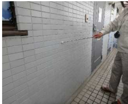
「外部（外壁）」調査の様子