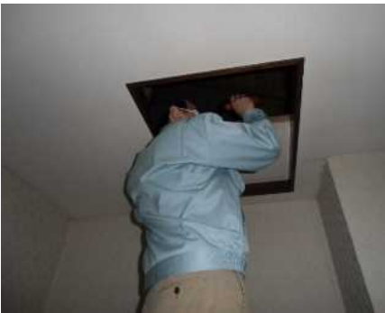
「小屋組・梁」調査の様子