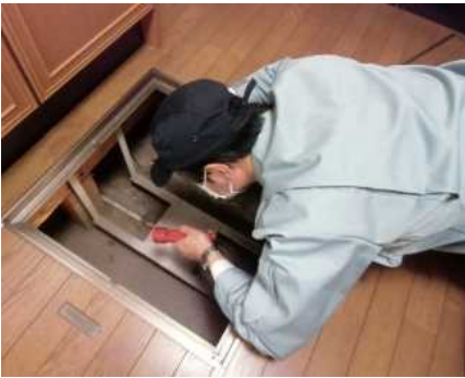
「土台・床組、基礎」調査の様子